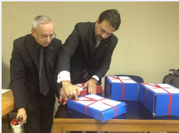
Zapečatenie procesu beatifikácie